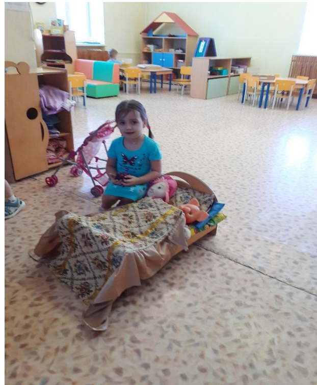
Праздник «Мамин день с котенком»