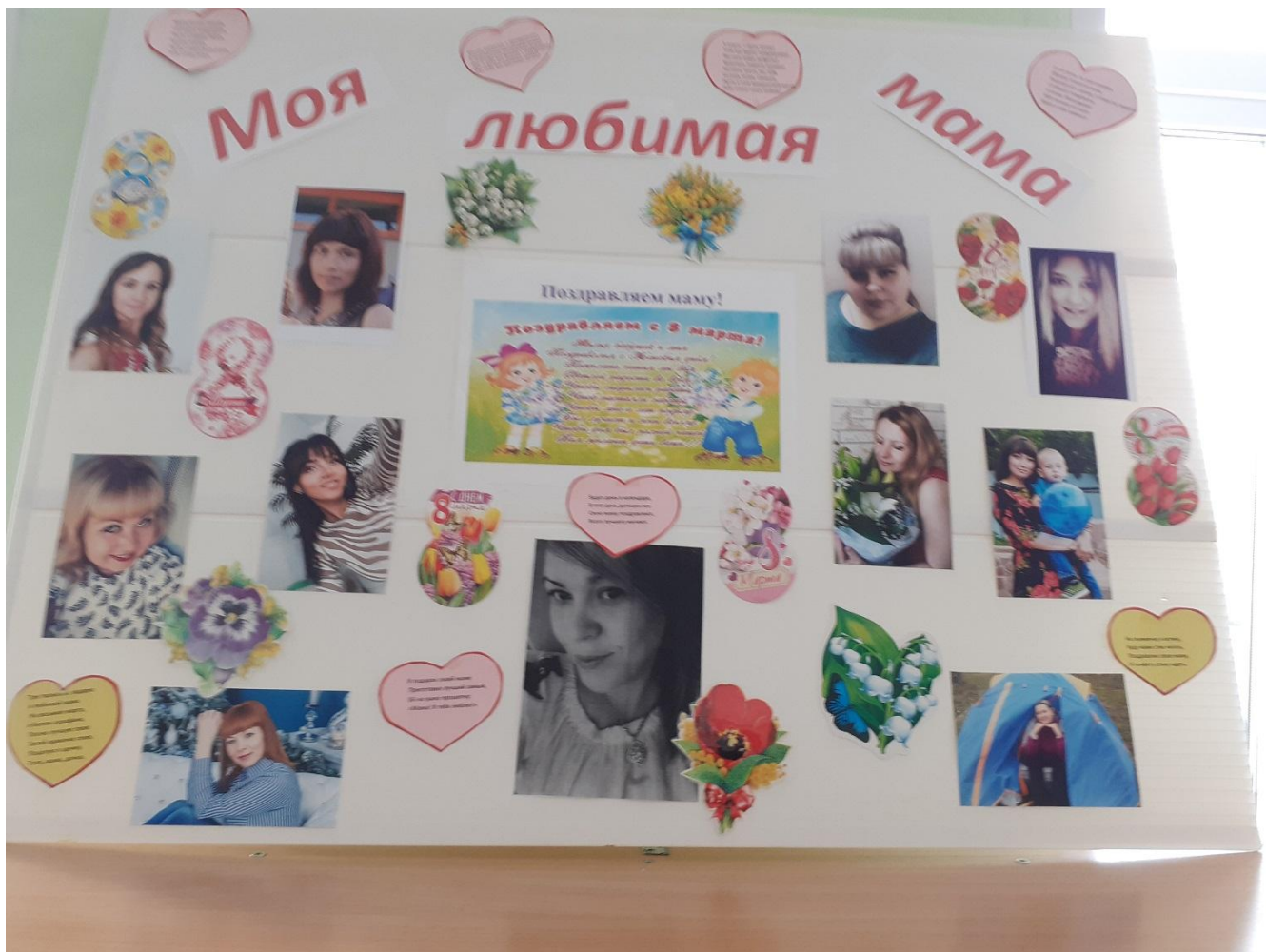
Беседа о празднике «8 марта»