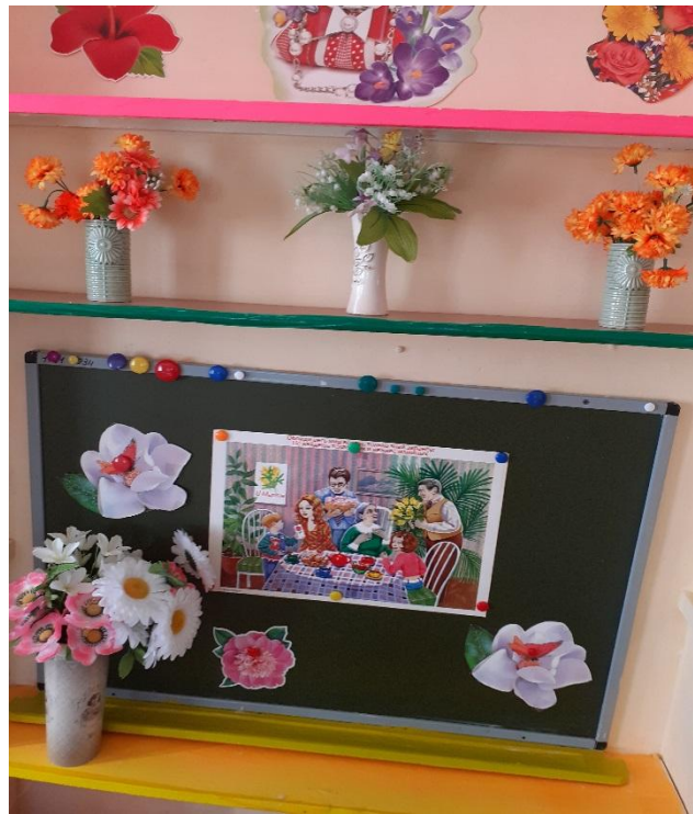
Рисование «Цветы для мамы»