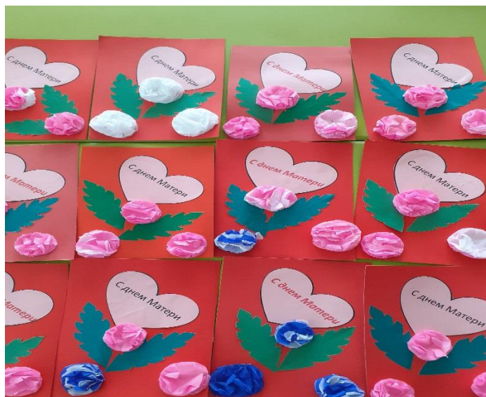
Приложение 6. Фотогазета «Все начинается с мамы...»